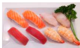
34. Sushi Mix 8pz