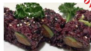
109. Uramaki Black Salmon Con Riso Venere, Salmone e Avocado