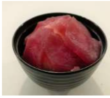
66. Tekka Ju Tonno