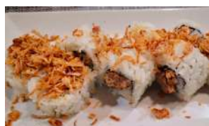
107. Uramaki Crispy Salmone cotto, philadelphia e pezzini di cipolle crispy fritte