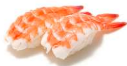
21. Ebi gambero cotto

(Fette di pesce su polpettine di riso gohan 2 pz)