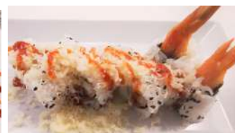
103. Tempura Ebiten Ebiten con aggiunta di pastella croccante