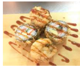
72. FutoMaki Fritto