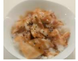
69. Hoyako Ju Pollo e salsa Teriyaki

Tutti i Ju Mono sono delle ciotole di Riso con sopra vari ingredienti