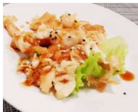
149. Pollo alla piastra Pezzi di pollo cucinati sulla piastra