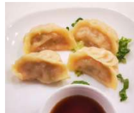
✻ 7. Ravioli di pollo (4pz) Al vapore con erba cipollina