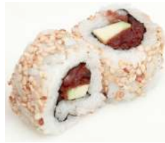
92. Uramaki Tuna Tonno ed Avocado