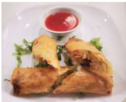
✻ 5. Involantino primavera (2pz.) Involantino con verdure fresche di stagione.