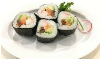
71. FutoMaki Rotolo con surini, funghi avocado, salmone, cetriolo