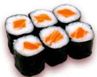
40. Maki Salmone