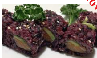
110. Uramaki Black Tuna Con Riso Venere, Tonno e Avocado