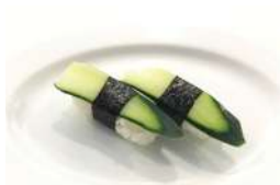
✿ 30. Cetriolo