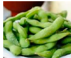
✻ 11. Edamame Fagioli di soia lessati e salati