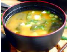
✻ 1. Miso Shiru Zuppa giapponese a base di soia con tofu fresco alghe ed erba cipollina.