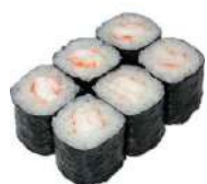
44. Maki Ebi gambero cotto