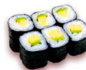
✿ 43. Maki Avocado