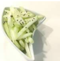
✻ 13. Cetriolini in aceto con zucchero