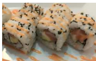
95. Spicy Salmone Salmone, Avocado Philadelphia e Salsa Osaka Piccante