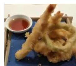
163. Tempura Mista Tempura con 5 pezzi di verdura e 2 di gamberi