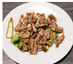
155. Manzo alla Piastra Pezzettini di manzo cotti sulla piastra con salsa speciale e sesamo