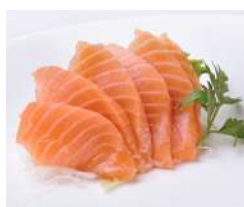
56. Sashimi Salmone