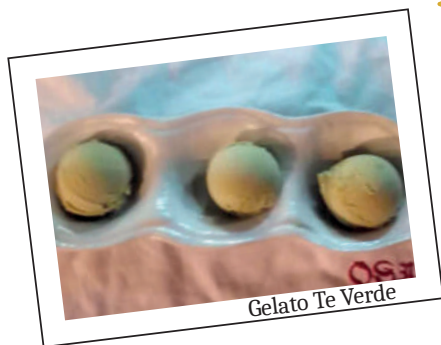
Gelato Te Verde