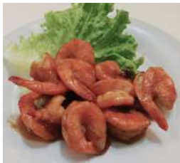
146. Gamberi Piastra Gamberi cucinati alla piastra con salsa speciale