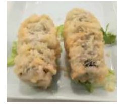
✻ 4. Geisha Maki Cetriolo fritto in tempura