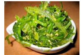
✻ 12. Alge Wakame Alge giapponesi con sesamo