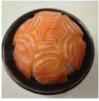
65. Sake Ju Salmone

(Vari tipi di pesce serviti in una ciotola di riso per il sushi)