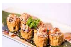
46. Maki salmone Fritto e Phila con salsa Teriyaki