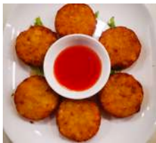
✻ 9. Mini Korroke Crocchette giapponesi a base di patate e cipolla.