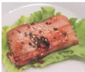
157. Tonno alla Piastra