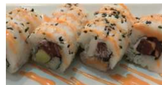
96. Spicy Tuna Tonno, Avocado Philadelphia e Salsa Osaka Piccante