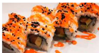
105. Uramaki Tobiko Salmone e avocado con all'esterno tobiko e salsa spicy con maionese