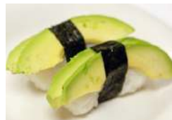
✿ 31. Avocado