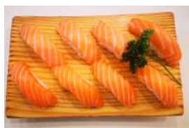
33. Salmone 8pz