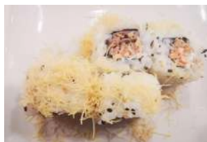
94. Uramaki Salmon Cotto Salmone cotto e philadelphia