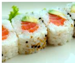
91. Uramaki Salmone Salmone ed Avocado