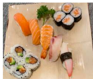
82. Tagliere 5 pezzi nigiri, 4 pezzi uramaki, 4 pezzi maki