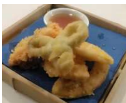
161. Tempura di Verdure 5 pezzi di verdure miste in tempura