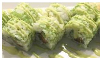
97. Wasabi Maki Salmone, Avocado, philadelphia, tobiko e salsa piccante a base di maionese