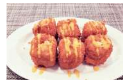
✿ 47. Maki Formaggio Fritto con salsa al mango