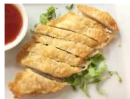
✻ 10. Tori Kaarage Crocanti filetti di pollo in tempura