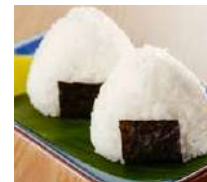
32. Sushi Gohan Con salmone Cotto