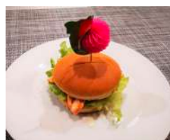
19. Tuna Burger Panino con Tonno alla piastra e salsa