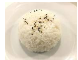
✻ 17. Gohan Riso bianco al vapore