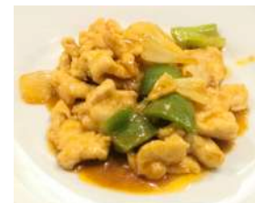
151. Pollo al Curry