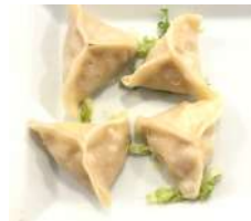
✻ 6. Ravioli giapponesi (4pz.) Carne e verdure al vapore.