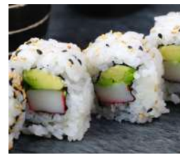
93. California Roll Avocado, surimi e cetrioli