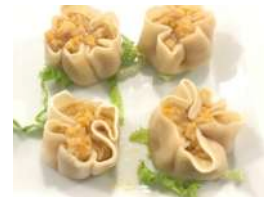
✻ 8. SaoMai Ravioli di gamberi e carne al vapore.