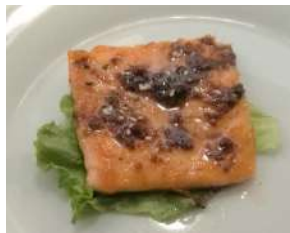
158. Salmone alla Piastra Salmone cotto sulla piastra con salsa