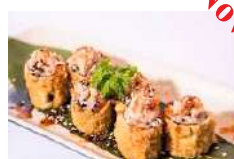
46A. Maki Tonno Fritto e Phila con salsa Teriyaki