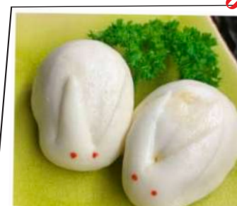
Coniglietti alla crema