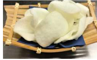
✻ 3. Nuvole di Drago Sfogliattine fritte di gambero