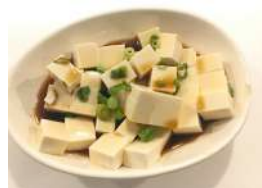
✻ 14. Tofu Fresco Formaggio di soia con salsa di soia