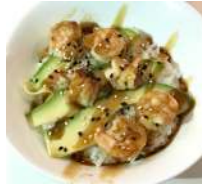
67. Ebi Ju Riso con gamberi, avocado e salsa Teriyaki.