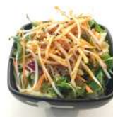
✻ 15. Osaka Salad Insalata mista con sesamo e salsa speciale