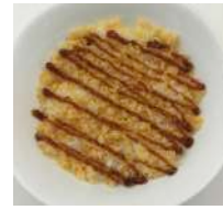
68. Ten Ju Farina di Tempura