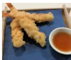
162. Tempura di Gamberi 3 pezzi di gamberi in tempura