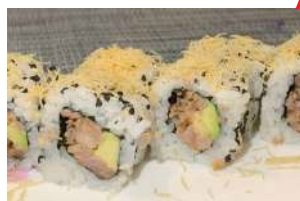
94A. Uramaki Tonno Cotto Tonno cotto, Avocado e philadelphia