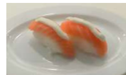
25. Salmone Philadelphia