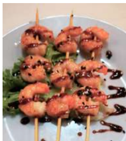
153. Spiedini di Gamberi 3 Spedini di gamberi con salsa speciale e sesamo