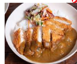
20. Katsu Curry Pollo Ciotola di Riso Sushi con Pollo Fritto e salsa al Curry