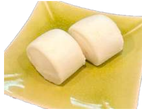
✻ 2. Pane Cinese Soffice Pane bianco cinese, cotto al vapore