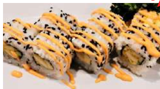
108. Uramaki Tori Pollo Fritto, Avocado e sopra salsa Rosa