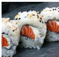
90. Philadelphia Roll Philadelphia e Salmone

(Rotolo di sushi con alga interna e riso esterno)