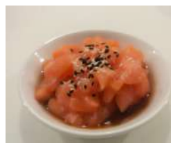
61. Tartare Salmone