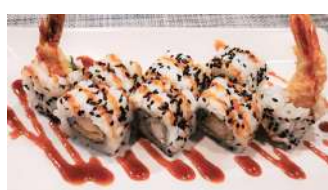
102. Ebiten Roll Tempura di gamberi, maionese e salsa speciale