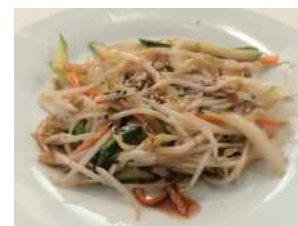
159. Verdure Miste Verdure miste saltate con salsa speciale e sesamo