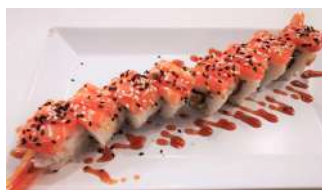
99. Tiger Maki Gambero fritto, Philadelphia, Salmone e salsa speciale