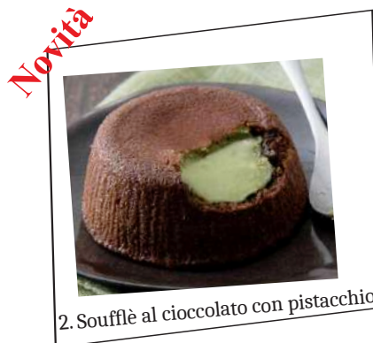
2. Soufflè al cioccolato con pistacchio